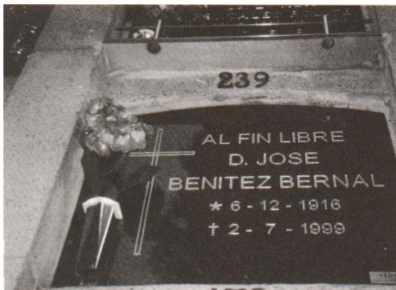
En «AB-BÁ», Cabo de Plata, siendo las 12.15 h. del 31 de enero de 2000.