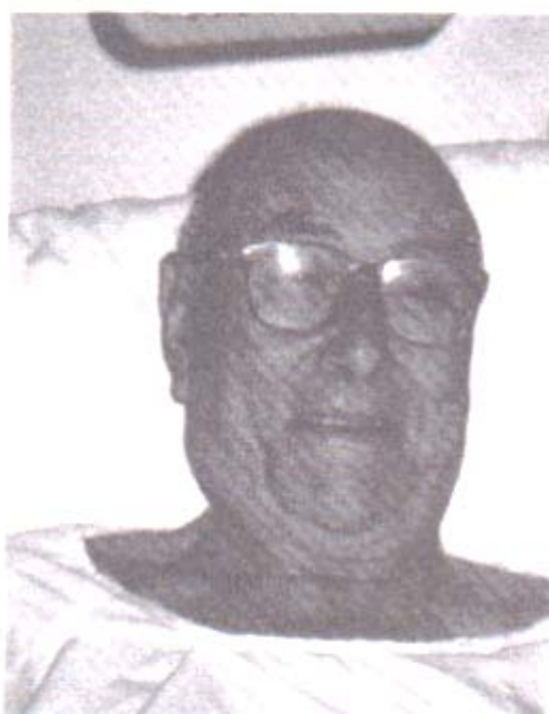
Mi padre, poco antes del sueño de la muerte.

—No seas impaciente. Te lo estoy contando. Es un lugar enorme, de techo alto. Un edificio enteramente de cristal.