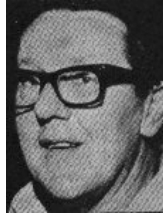
Brian W. Aldiss

Título original: Space, Time and Nathaniel