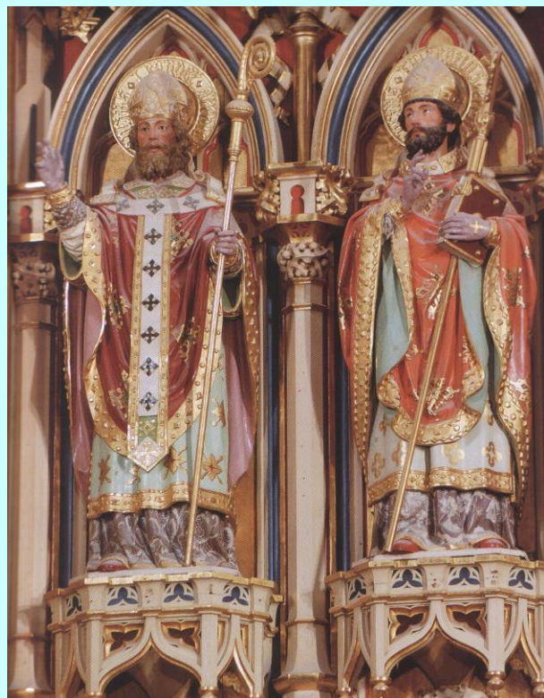
San Leandro y San Fulgencio Catedral de Murcia